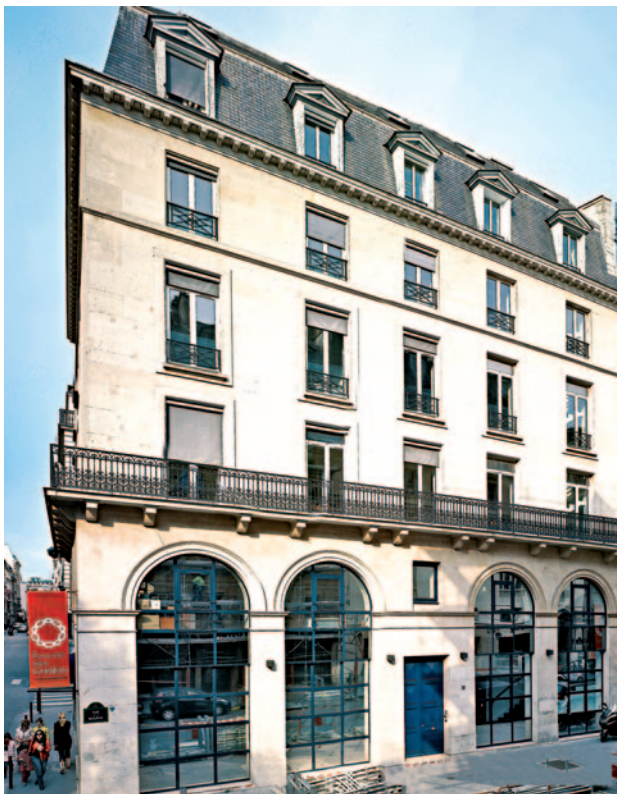
12, rue de la Bourse • Paris 2 ème